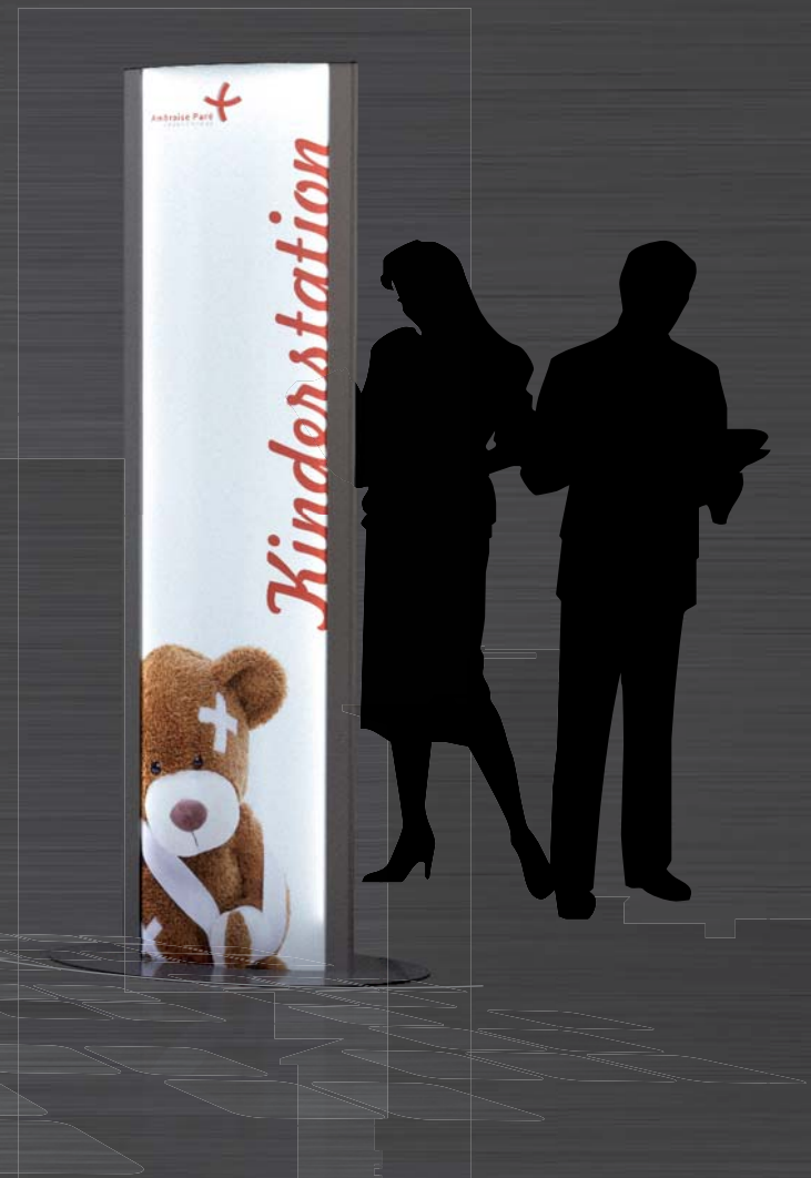
Innenaufsteller - beleuchtet