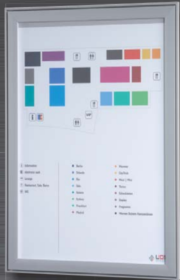
Modell C ..... model C