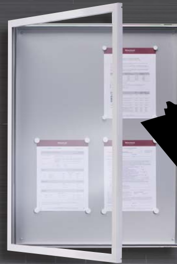
Modell D ..... model D