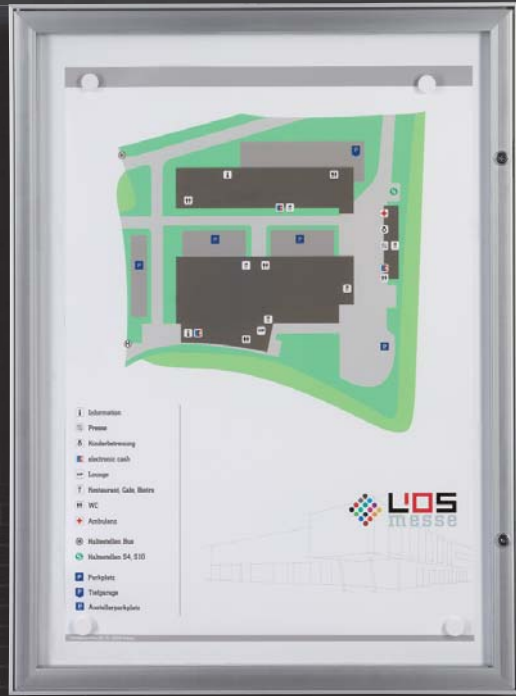
Modell C model C