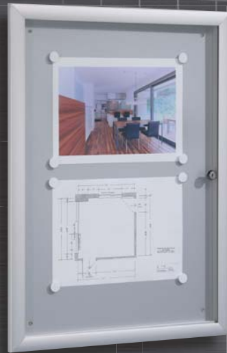
Modell M ..... model M