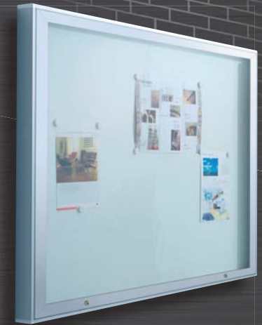
Modell B ..... model B