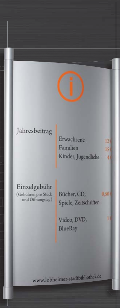
Außen- / Hauptwegweiser exterior / main direction sign

Schwebend und avantgardistisch → SYDNEY scheint vor der Wand zu schweben. Bereits der für außen und innen geeignete Hauptwegweiser besticht durch seine runden Formen. Raffinierter Hingucker sind die papierflexiblen Innenschilder: ihre einseitige Wandhalterung aus eloxiertem Aluminium und ihre asymmetrische Form mit einer leicht gewölbten Trägerplatte setzen markante Akzente. Die Modellreihe wird so zum unübersehbaren Bestandteil zeitgenössischer architektonischer Konzepte.